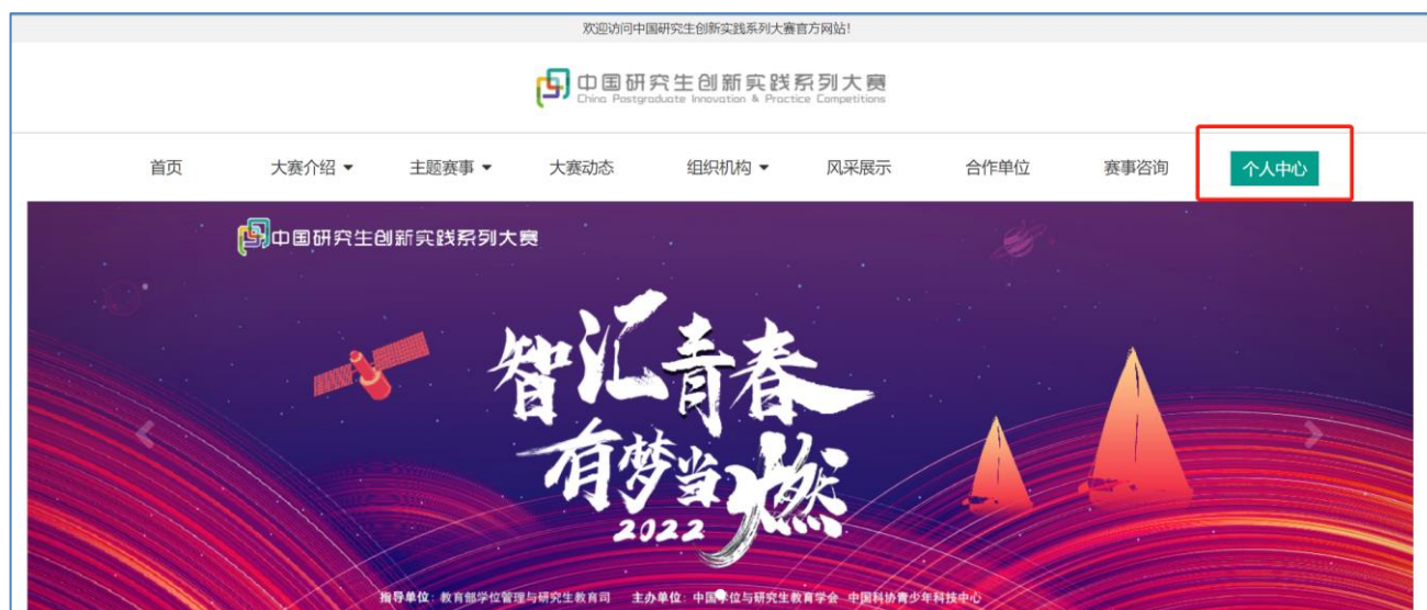
图 平台官网点击个人中心后可进入我的赛事进行报名（需先登录）