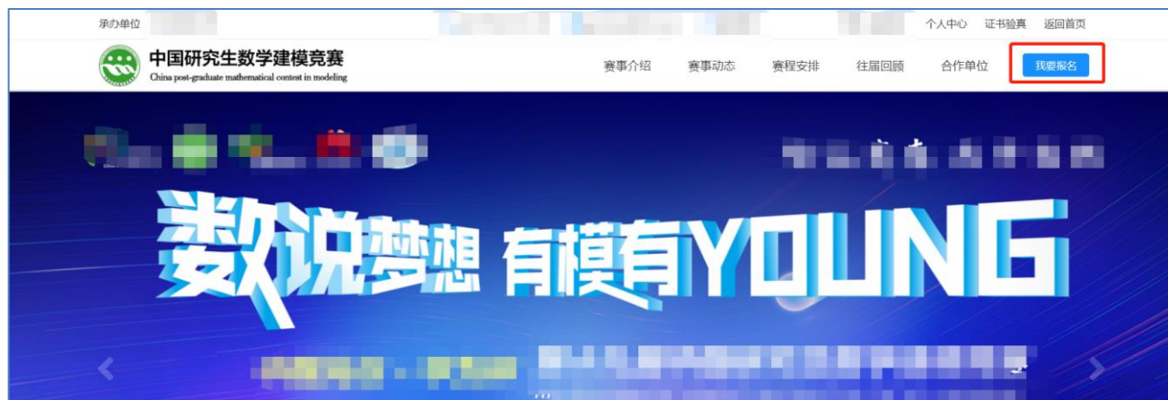
图 赛事官网我要报名入口（需先登录）