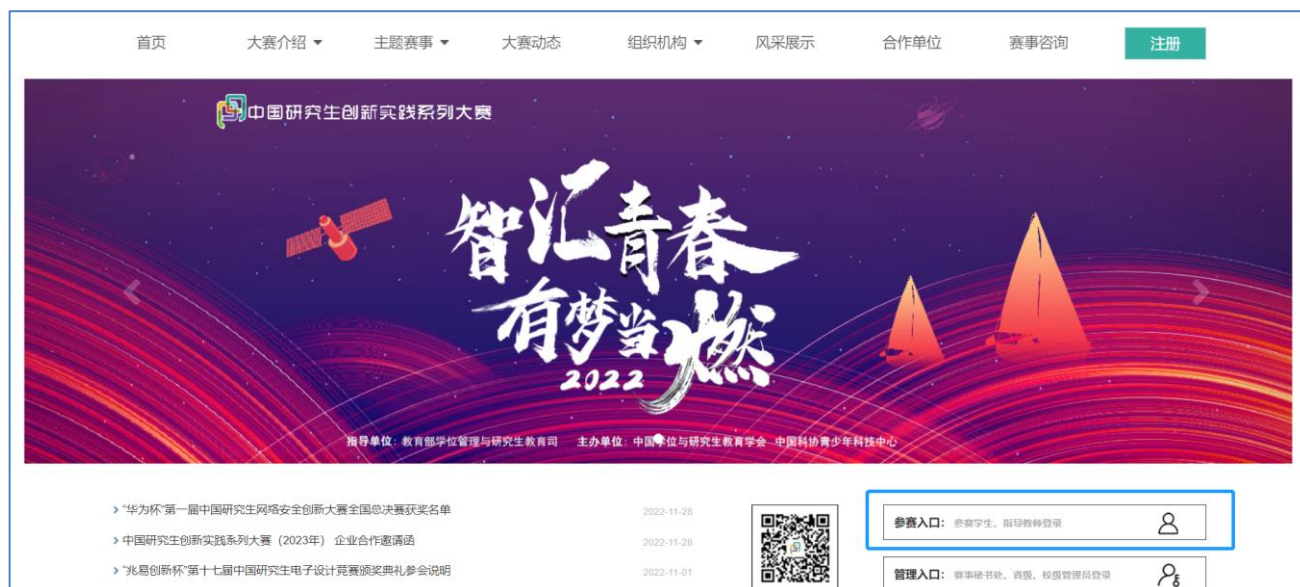
图 平台官网登录窗口