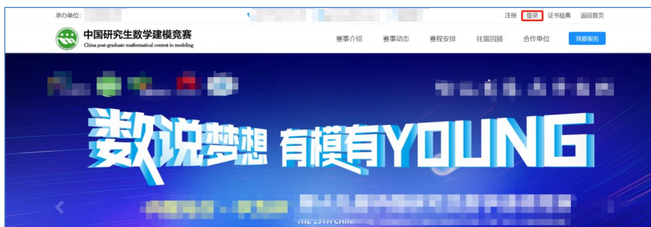
图 赛事官网登录窗口