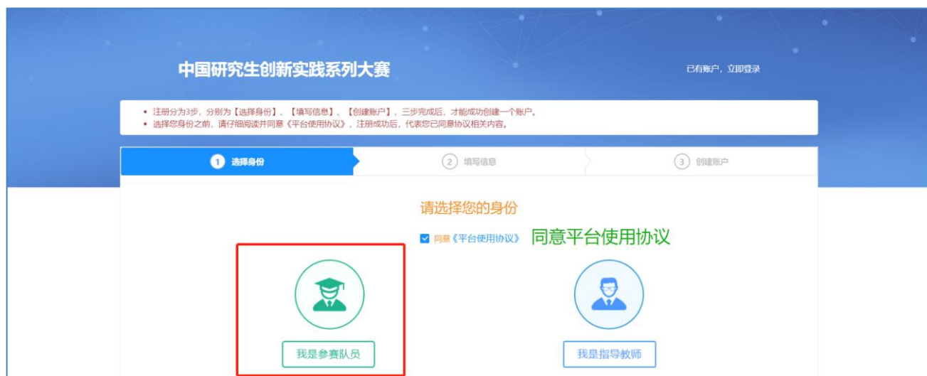
图 用户注册第一步-选择身份